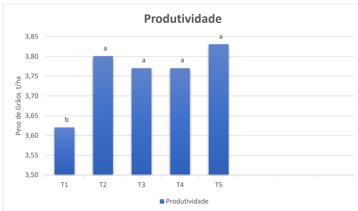
Figura 2 – Valores médios do caractere Produtividade de Grãos (PG) em relação à utilização do manejo de pré emergentes na cultura da soja.

T1 – Testemunha; T2 – Spider; T3 – Zethamaxx; T4 – Stone, T5 – Dual Gold